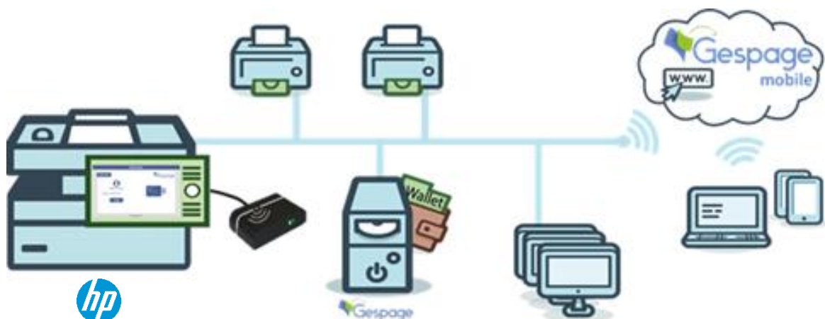
Schéma d'une configuration réseau

Ce logiciel eTerminal-HP est compatible avec tous les MFP FutureSmart. Cette évolution rend la solution Gespape plus compétitive. En outre, cette solution s'intègre parfaitement à l'ergonomie des matériels HP.