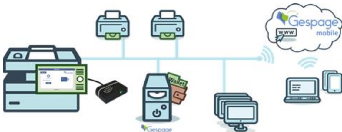
Schéma d'une configuration réseau

Ce logiciel eTerminal-KonicaMinolta est compatible avec tous les MFP disposant au minimum d'OPEN API V3.6. Cette évolution rend la solution Gespape plus compétitive. En outre, cette solution s'intègre parfaitement à l'ergonomie des matériels KONICA-MINOLTA.